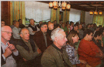
Großer Andrang bei der Projektpräsentation im Gasthaus Mandl-Scheiblechner: Zusätzliche Sessel wurden in den Saal gestellt.